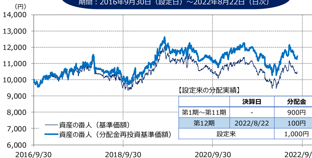
【設定来の分配実績】