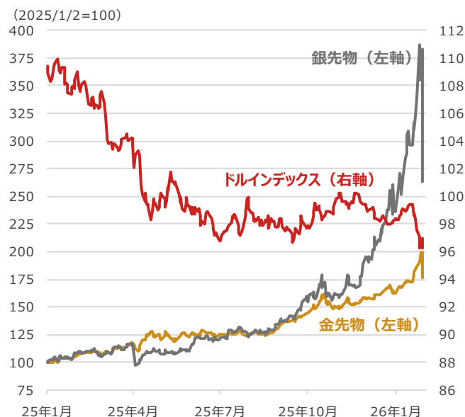
金・銀先物とドルインデックス

期間：2025年1月2日～2026年1月30日、日次 ・金・銀先物はニューヨーク商品取引所で取引されている値を用いた ・ドルインデックスは米ドルの総合的な動きを示す指数